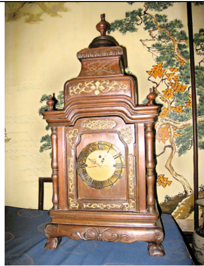
圖二：利瑪竇在中國造的自鳴鐘 (圖中所示為複製品) 利瑪竇進京時曾獻自鳴鐘予明神宗